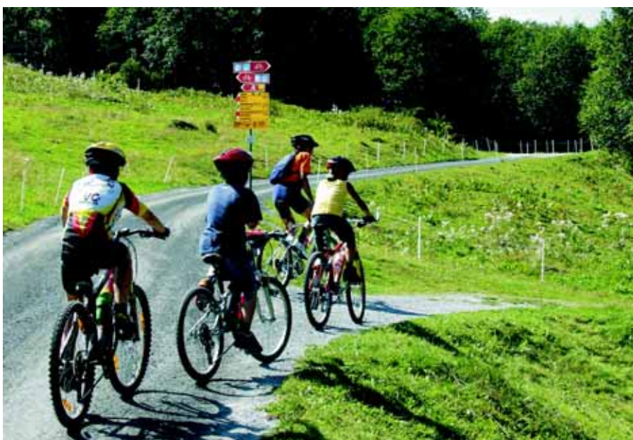
Itinerari escursionistici e ciclistici ben segnalati e ben sviluppati in tutto il Cantone sono uno dei principali pilastri del turismo estivo.

Per via della sua struttura topografica, i Grigioni sono destinati ad ess-