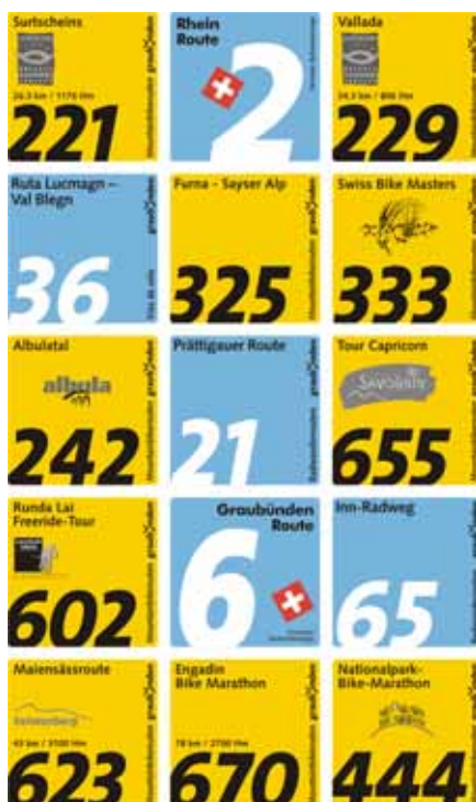
Un concetto di itinerari presentato in modo unitario a livello cantonale

Oltre alla qualità dei percorsi è di importanza decisiva la chiara segnaletica di questi itinerari. Negli ultimi anni l'Ufficio tecnico ha realizzato, insieme all'Ente grigionese pro sentieri e a Grigioni vacanze, un progetto che si trova in accordo con le attività svolte in questo ambito a livello nazionale. Attualmente l'Unione dei professionisti svizzeri della strada (VSS) sta rielaborando