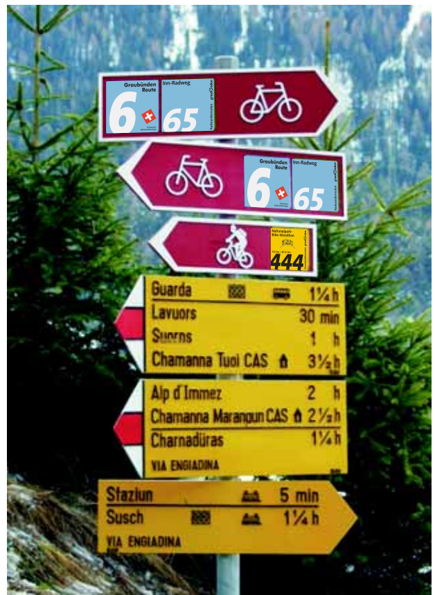
Armonica coesistenza di indicatori di percorsi ciclabili, per mountain bike ed escursionistici

Nei Grigioni, oltre ai 10'000 chilometri di sentieri escursionistici, sono finora stati segnalati secondo questo concetto 470 chilometri di percorsi ciclabili e oltre 50 itinerari per mountain bike, per una lunghezza di circa 700 chilometri. Il Dipartimento costruzioni, trasporti e foreste del Cantone dei Grigioni sostiene l'ampliamento delle infrastrutture per le escursioni a piedi e in bicicletta con un contributo di 400'000