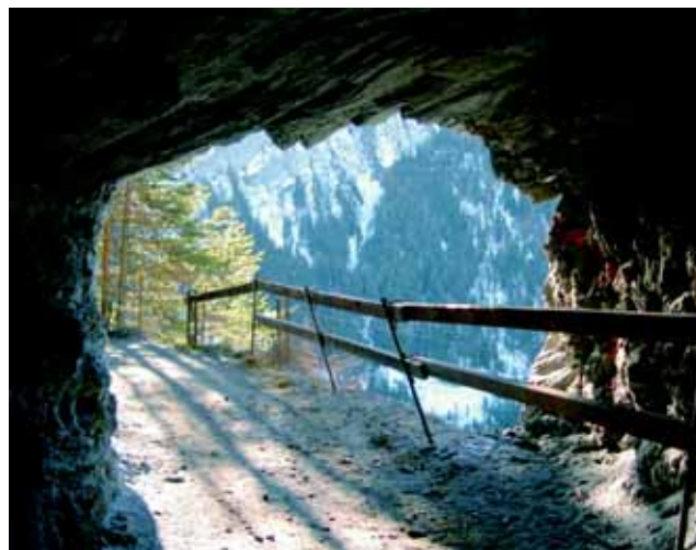
Il portale a rischio di crollo della galleria Moir, il culmine dello storico collegamento nella Schin.

La strada della Prettigovia rientra tra le strade principali più trafficate del Cantone. Parallelamente ad essa corre l'attrattivo percorso ciclabile regionale 21 (Sargans - Klosters). Sul tratto Landquart - Fideris Au esso corre lungo la vecchia strada della Prettigovia e lungo strade di campagna. In questo tratto la strada della Prettigovia non può essere percorsa dalle biciclette. Per contro a partire da Fideris Au e fino a Klosters, la A28 viene utilizzata anche da ciclisti, cosa che rappresenta un notevole rischio per la sicurezza di tutti gli utenti della strada. La corporazione regionale ProPrättigau ha perciò assunto l'iniziativa e fatto elaborare un